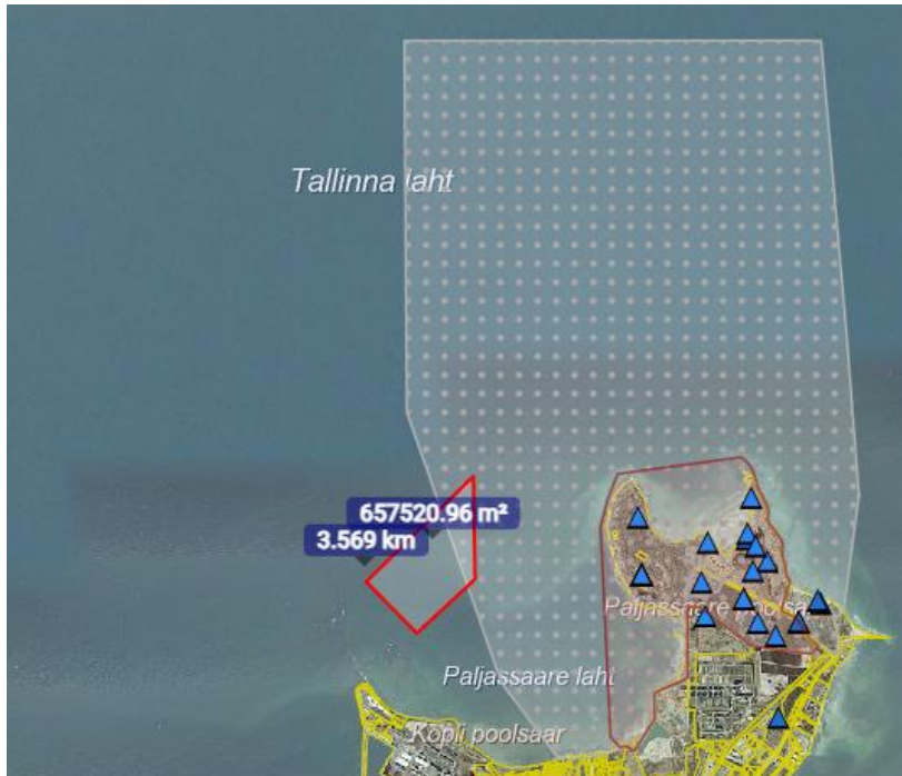
Joonis 2: Paljassaare kaadamisala (helepunane trapets), Paljassaare hoiuala (KLO2000168) (tumepunane ala), projekteeritav Paljassaare kaitseala (valgete täppidega ala).

Vee erikasutusega seotud mahud on järgnevad: